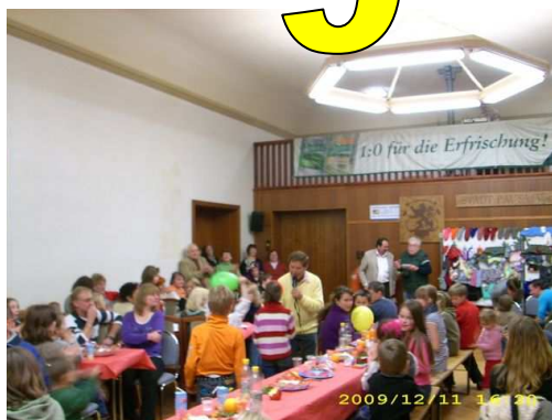
11.12. Weihnachts-Charity der ALI Sachsen e.V.