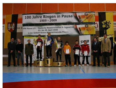
100 Jahre Ringen in Pausa