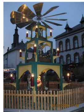
05.12. Pausaer Weihnachtsmarkt mit Pyramide