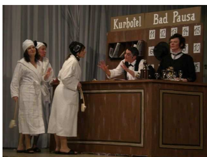
13.-23.02. Faschingsveranstaltungen des FCP Pausa