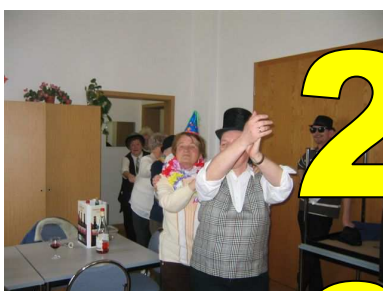
17.02. Seniorenfasching der Volkssolidarität