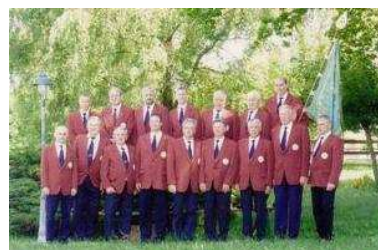
13./14.06 170 Jahre MGV „Harmonie“ Ranspach mit Verleihung der Zelter Plakette