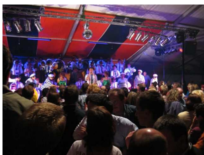
29. - 31.05 6. Große Musikshow in Thierbach