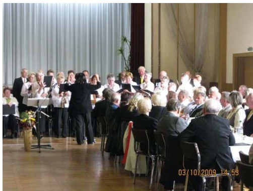
03.10. Festveranstaltung „20 Jahre Wende“